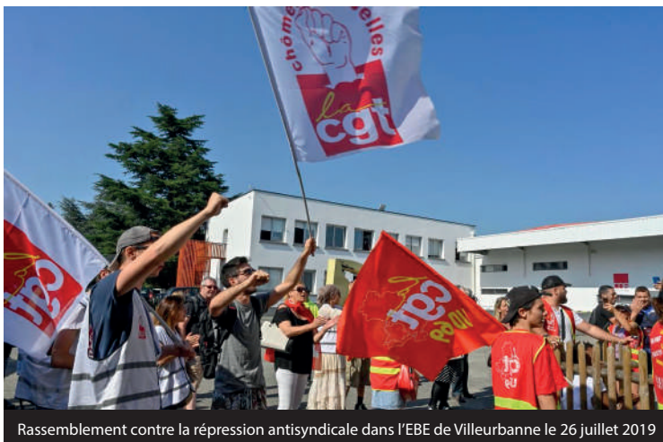
Rassemblement contre la répression antisyndicale dans l'EBE de Villeurbanne le 26 juillet 2019

A chaque fois, les directions jouent sur la fragilité de ces travailleurs privés d'emploi depuis longtemps, en exerçant sur eux une pression permanente (sur le seul territoire de Mauléon, on compte une trentaine de démissions pour 65 salariés au 30 juin 2018) pour leur imposer l'absence de droits et les éloigner du syndicat. Cependant, l'action des comités locaux de privés d'emploi a permis la syndicalisation de ces travailleurs éloignés du syndicalisme, la création de syndicats CGT et la constitution de listes, comme à Colombelles, et la victoire de celle-ci à Villeurbanne.