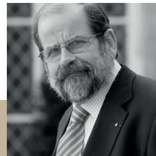
Michel Davy de Virville

« Sous sa direction, près de 20 000 emplois de cheminots ont été détruits à la SNCF, et 18 000 à PSA ! »