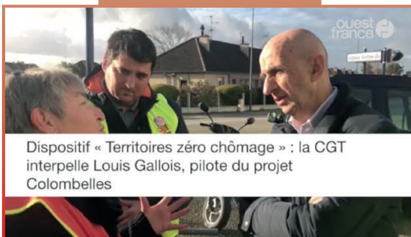
Dispositif « Territoires zéro chômage » : la CGT interpelle Louis Gallois, pilote du projet Colombelles

Ancien DRH du groupe Renault, président de la commission du MEDEF « Relations du travail », F. Fillon lui confie en 2004 la rédaction du rapport « Pour un droit du travail plus efficace » où il défend le contrat de projet et le remplacement du CDI par un contrat de travail unique.